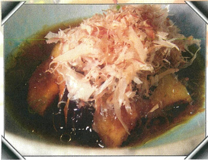
秋茄子の揚げだし 500円