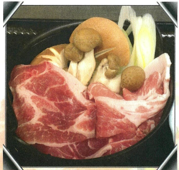
岩清水豚と木の子のすき焼き 1,000円

※掲載されている料理写真はイメージです。仕入れの状況等により内容変更となる場合がございます。